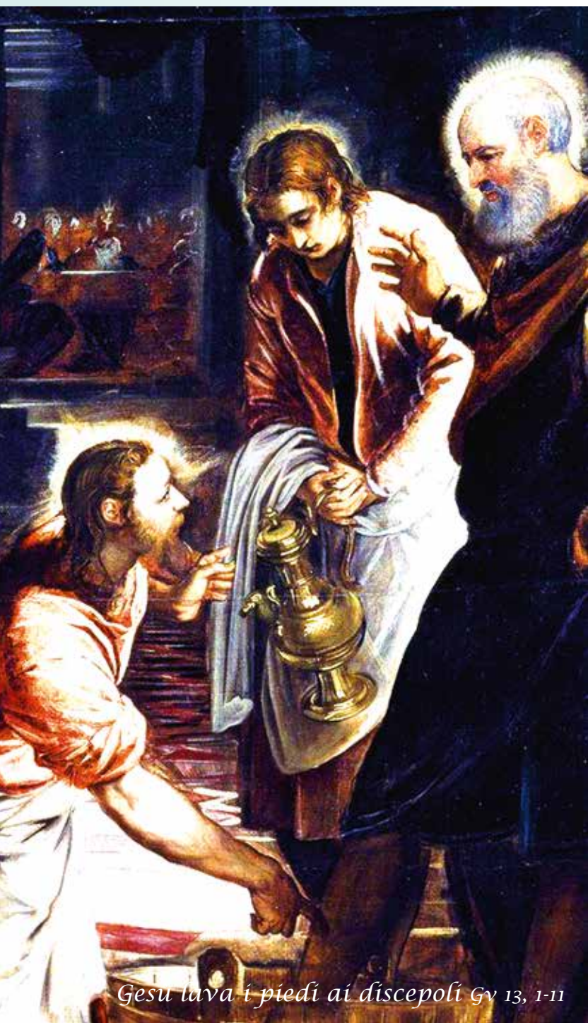
Gesu lava i piedi ai discepoli Gv 13, 1-11